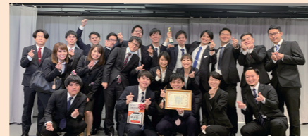
「どうするフィジカル〜キホンの身体診察〜」 (新研修医オリエンテーション)