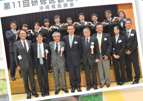
第11回研修医歓迎レセプション 沖縄県医師会

医師としての第一歩を踏み出す門出を県全体で祝い、毎年盛大なパーティーを催しております。当日は沖縄県知事も県代表として参加され、皆さんを歓迎します。また、3つの研修病院群に属する研修医達が、研修医間、指導医との親睦を深めることのできるパーティーとなっています。